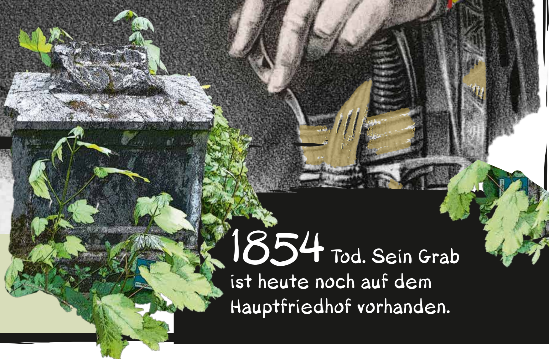
Bildquellen: Mlynek, Plan der „Freien Stadt Frankfurt am Main“ im Jahre 1845; k.k. Generalkriegsarchiv Semmering XX „Lafayette“-Uch ist vom Technischen Museum, Wien; handgezeichnete Stich-Palais-Meran nach Vorlage eines Gemäldes von Conrad Kreuzer; 1843; Lithographie Felix von Stregen, ÖNB; Kaiser Franz Joseph nach Originalmalerei von Johann Franz, 1851; Grabstein: A. Eichstaedt

1854 Tod. Sein Grab ist heute noch auf dem Hauptfriedhof vorhanden.